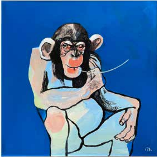
Blau, meinetwegen ...